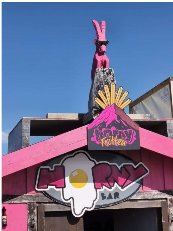
Pommes Frites aus der „Horny Bar“ - ...

Und zu guter Letzt ist nach dem Rennen auch immer vor dem Rennen: Das Datum für das 64. SVB-Skirennen wurde bekanntgegeben. Es findet am 22. und 23. März 2027 auf der Lenzerheide statt.